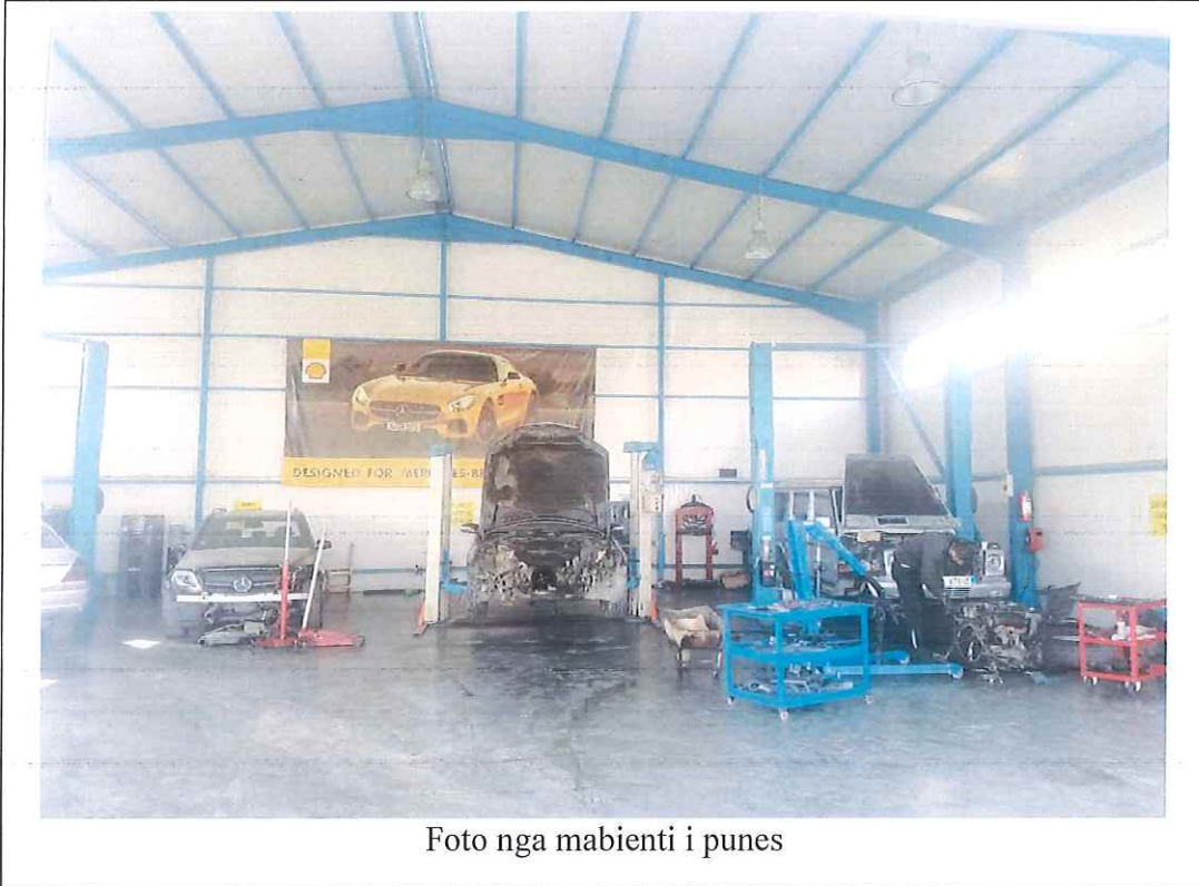
Foto nga mabienti i punes

Theksojme se ne kete objekt nuk behet lysterje e makinave. Per sa u perket vajrave te perdorura subjekti ne fjale ka te nenshkruar kontraten me shoqerine "Amos-Oil" shpk per transferimin e vajrave te perdorur.