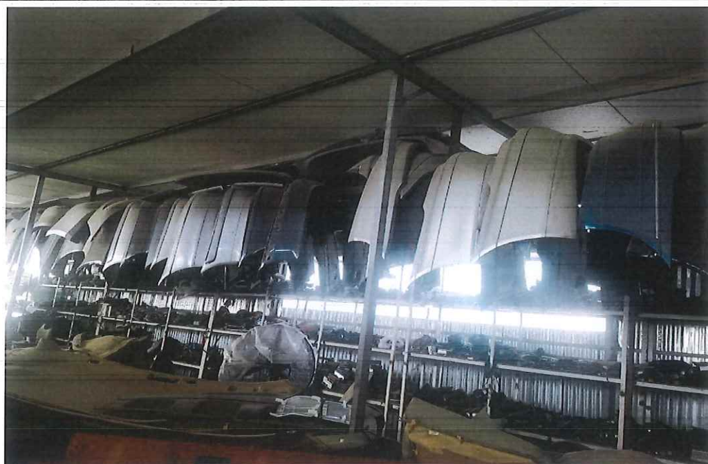
Pamje pas demontimnit te makinave