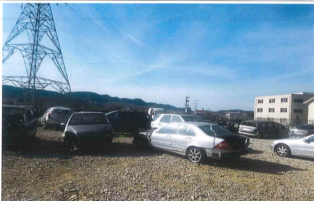
Pamje nga parkimi i servisit

Ndikimi ne mjedisin e zones ne kushte normale te punes, perhapet vetem ne mjediset e servisit. Nuk ka shkarkime te ujerave teknologjik. Ndikimi nga zhurmat do te jete present vetem ne mjediset e punes, ndersa mbetjet e ngurta qe dalin gjate proceseve te punes, te cilat jane mbetje 100% te perdorshme, dergohen per riciklim ne kompanite e licensuara per kete qellim.