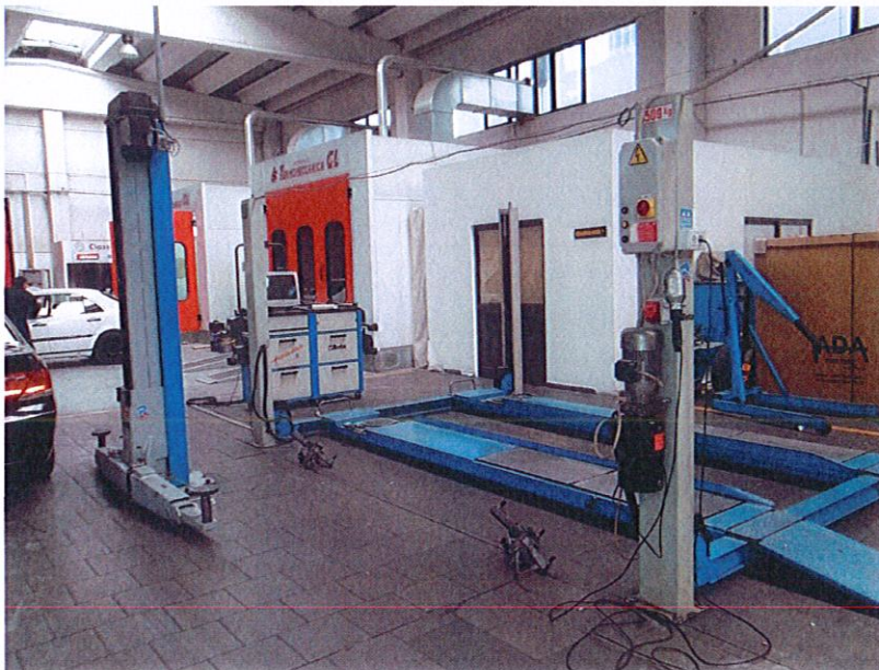
Linja e konvergences dhe kolaudimit