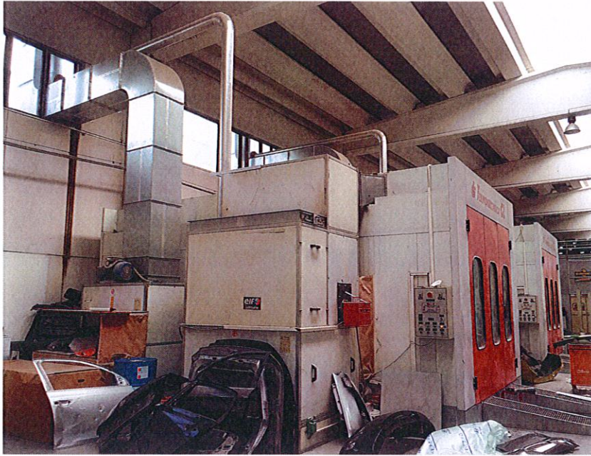
Impianti i filtrimit se ajrit te furrave te tharjes