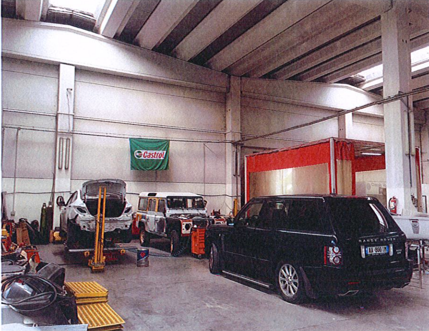
Reparti i shërbimeve të karrocërise