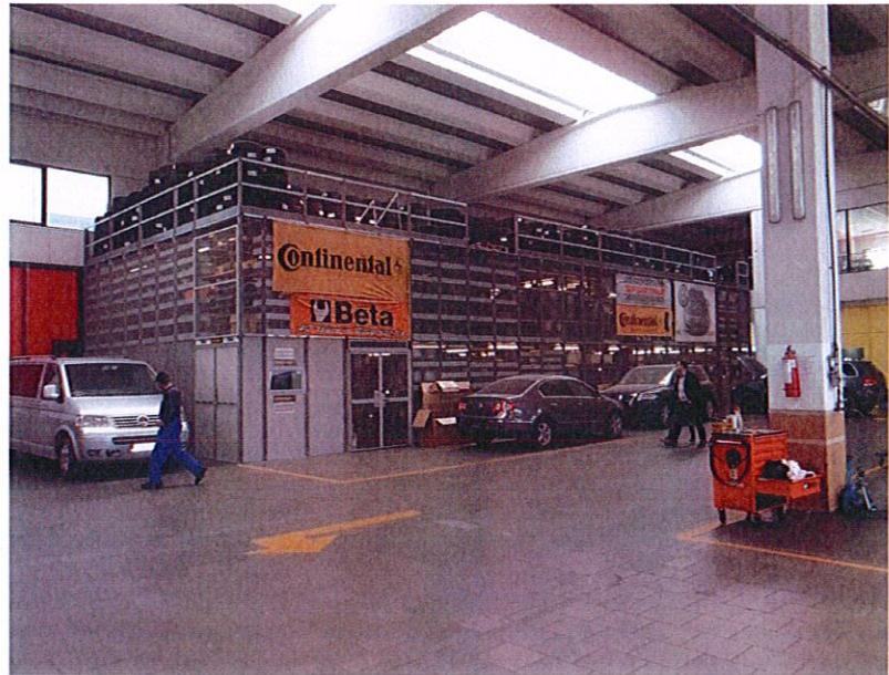
Ambjentete e ruajtjes dhe tregimit te gomave te reja per automjetet Volkswagen