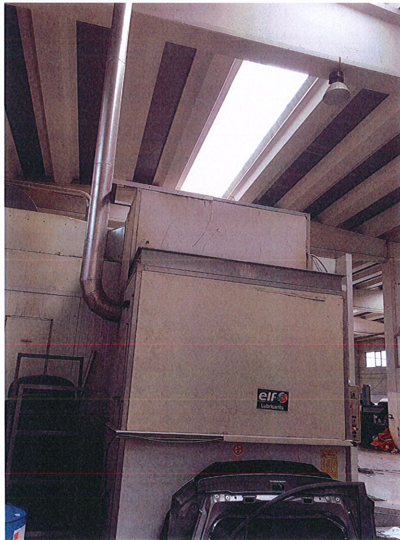
Kaldaja me lende djegese nafte