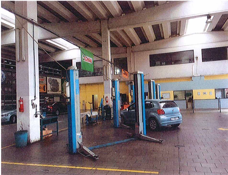
Reparti xhenerike elektroauto