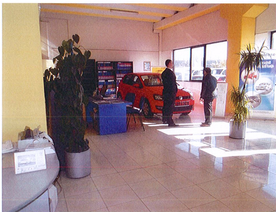
Salloni i tregimit dhe komunikimit me klientin