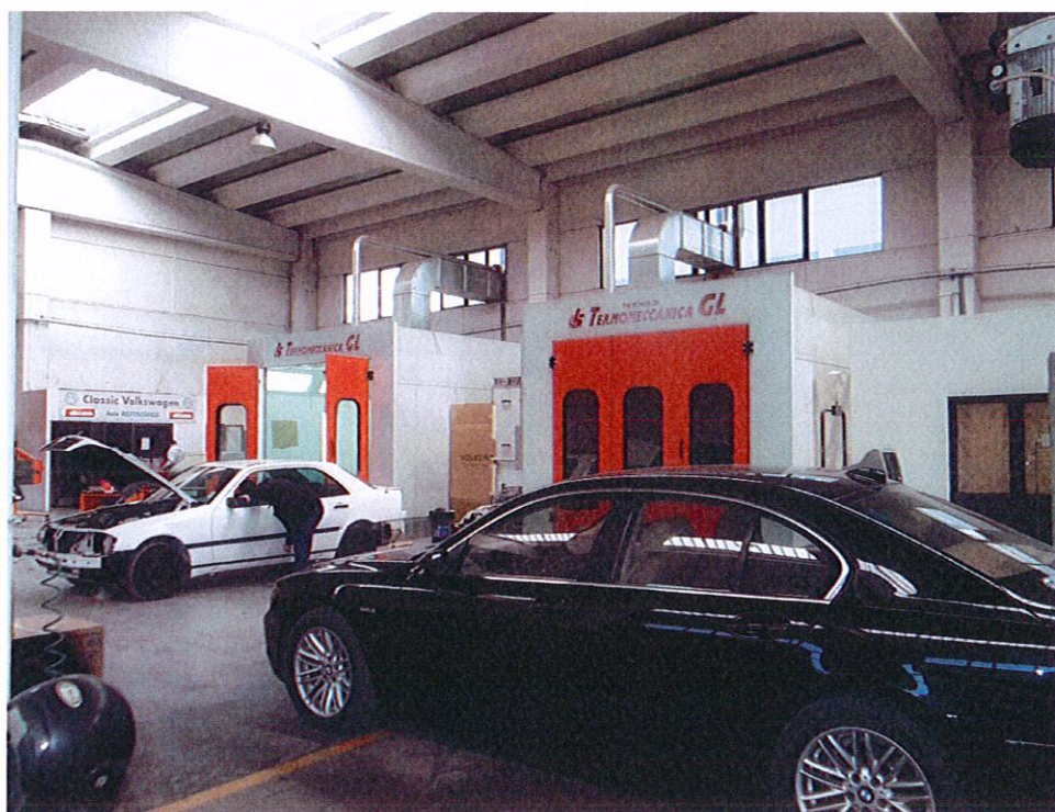
Dy furrat e tharjes