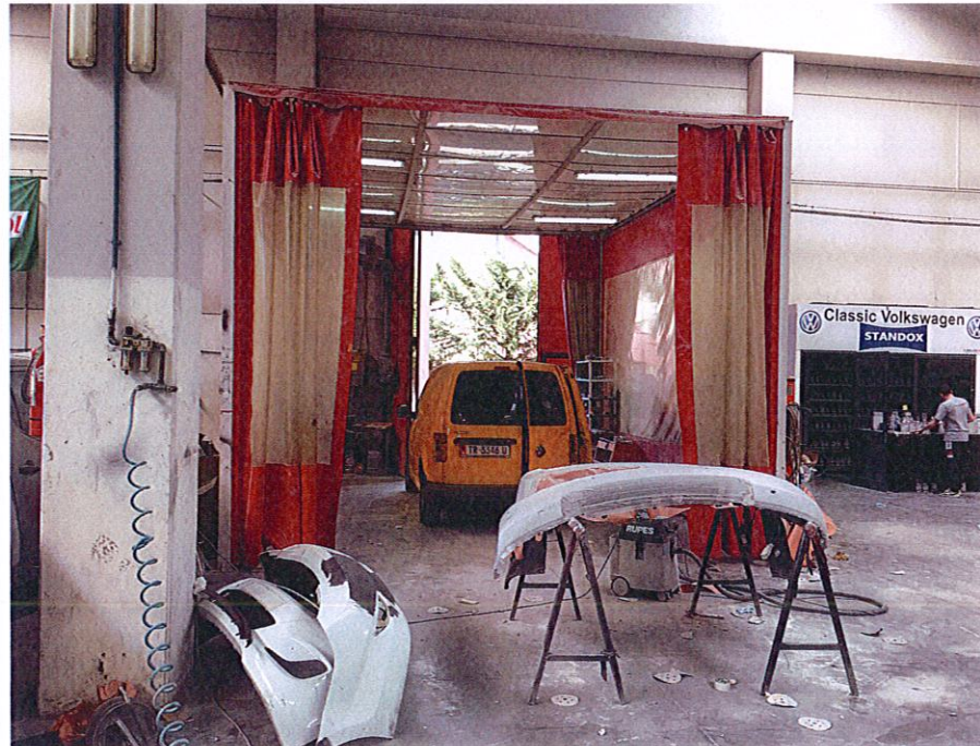
Dhoma e lysterjes