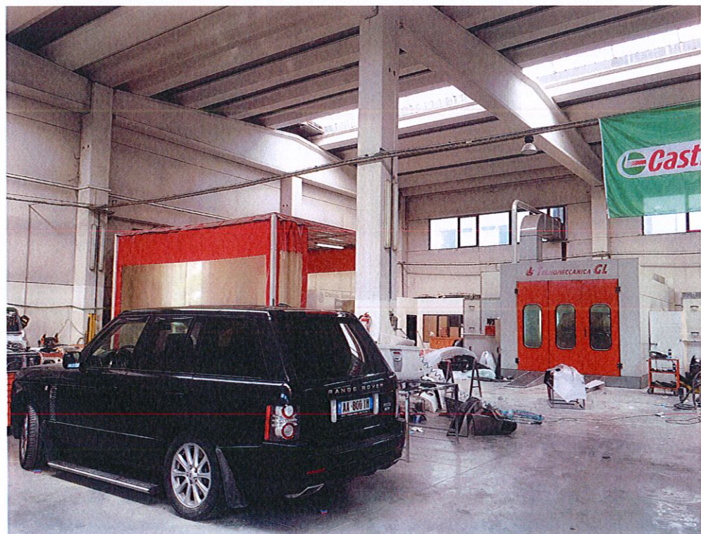
Reparti i shërbimeve të karrocërise