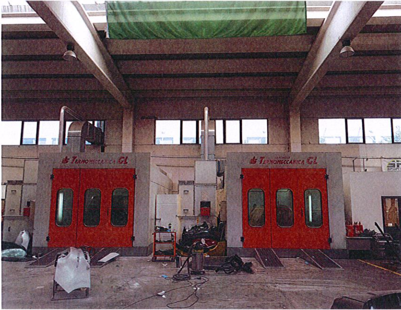
Reparti i sherbimeve te gomisterise