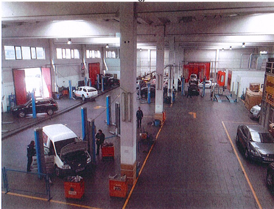
Pamje e plote e servisit