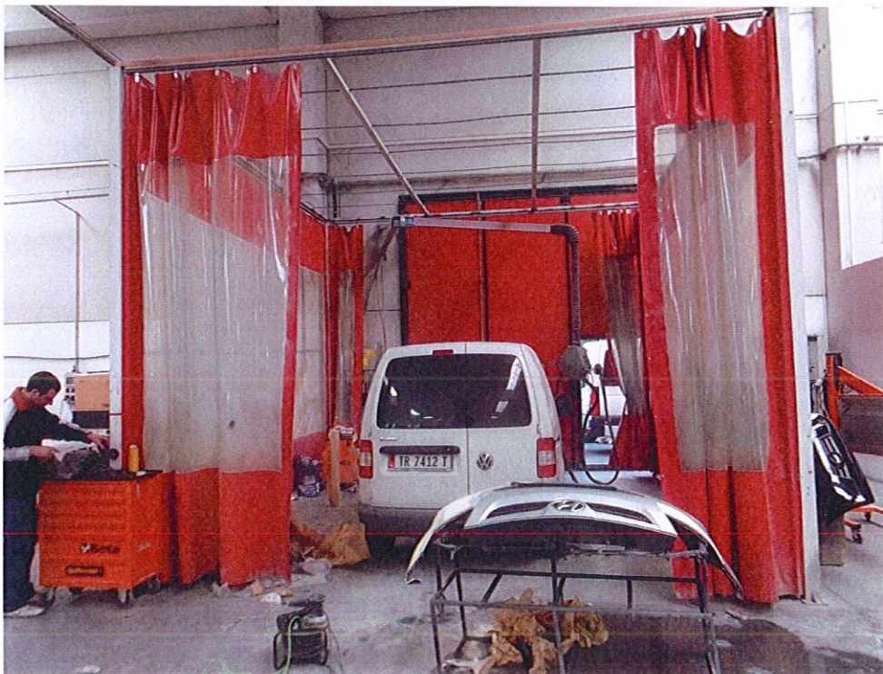
Dhoma e Iyerjes