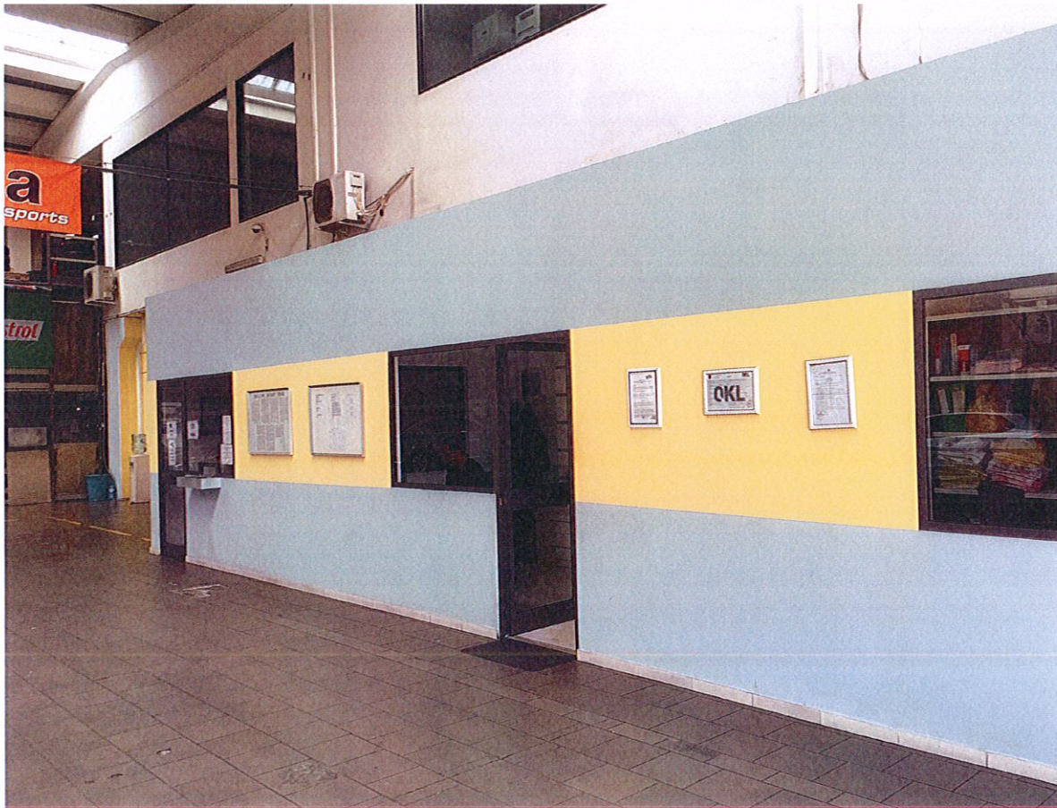
Magazina e pjeseve te kembimit

Ne kete objekt ka te vendosur nje aneks magazine ku do te fumizohen nevojat per ate pjese kembimi qe duhen zevendesuar, por me e rendesishmja do te kete, qe do te sherbeje per zevendesimin e pjeseve te kembimit per motorat e automjeteve ose autoveturave, te cilat gjate kryerjes se sherbimit ne autoservis kerkojne zevendesimin e menjehershem te tyre me pjese te reja. Per te fituar kohe, automjeti merr menjehere pjesen qe i nevojitet dhe sherbimi kryhet mjaft shpejt. Pra do te kete nje oficine autoservisi qe ka per qellim kryerjen e sherbimeve te mirembajtjes dhe riparimeve te motorrave te automjeteve te tipeve te ndryshme. Do te punoje ne pjesen me te madhe te kohes me nje turn ose edhe me gjate ne varesi te kerkesave.