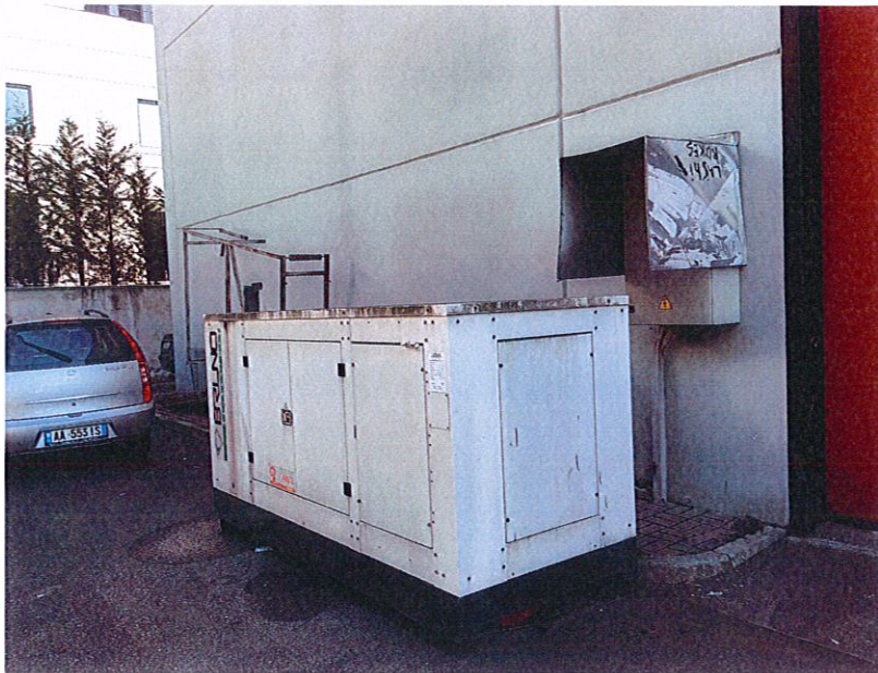
Gjeneratori i furnizimit me energji elektrike kur mungon furnizimi nga rrjeti