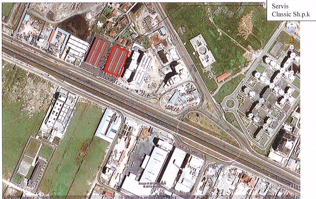
Pamje satelitore e zones ku ndodhet aktiviteti i shoqerise "Classic" Sh.p.k.