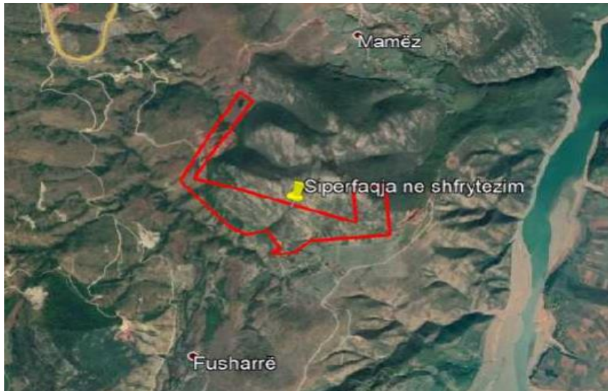
Ortofoto e vendodhjes se Kariertes nr. 1 dhe sheshit te vendepozitimit te sterileve