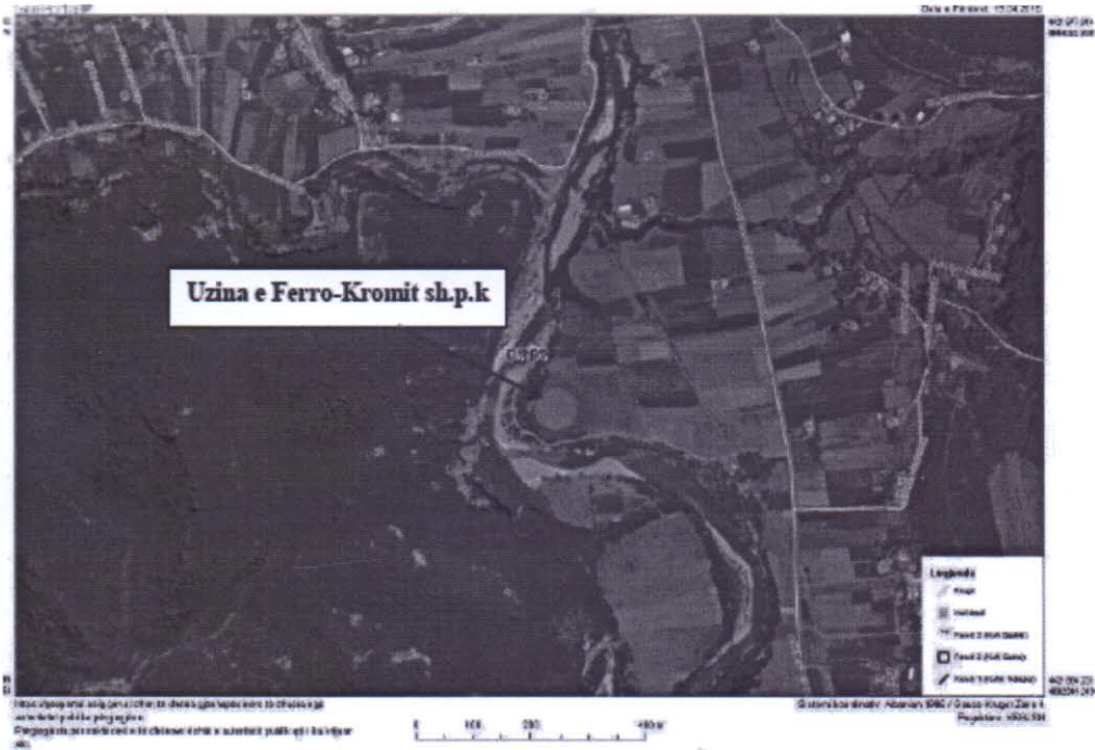
Figura 1. Pamja nga lart e Uzinen se Ferro-Kromit, Shoqeria A.S.C.Cr sh.p.k