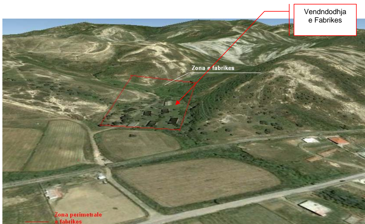
Pamje e zonës së fabrikës.

Fabrika e fishekzjarreve qe parashikohet te ngrihet ndodhet ne njeh distancë ajrore 1.2km ne zonën perëndimore jashtë qytetit të Peqinit ose 2km nga qendra e qytetit. Zona qe zeh fabrika ka njeh sipërfaqe totale prej 15156 m 2 dhe lidhet me rrugën kryesore me aneh të njeh rruge betoni me njeh gjatësi prej 400 metrash, dhe gjerësi 4m. Ne aneh jugore gjendet njeh linjeh hekurudhore ne njeh distancë ajrore 103m. Fabrika është e pozicionuar ne luginë dhe me gjelberim rreth e qark dhe mes kodrave qe e rrethojnë.