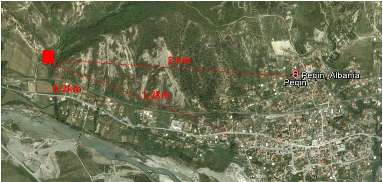
Pamje ajrore e pozicionit të fabrikës nga qyteti dhe rrethinat e saj.

Zona është tërësisht e izoluar dhe ndodhet larg vendeve që frekuentohen nga njerëzit si edhe nga çdo ndërtesë e banuar. Terreni është kodrinor dhe pjesërisht fushor dhe të gjitha ndërtesat ndodhen në atë fushor.