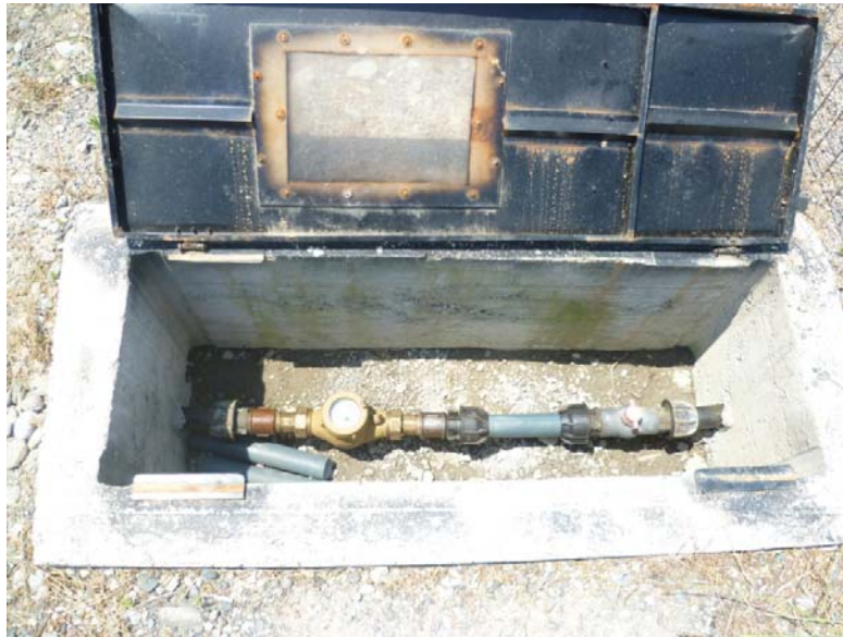
Pusi qe disponon shoqeria, i rrethuar me rrjet teli

Ujrat e ndotura nga pluhurat e krijuara gjate sperkatjes do te depozitohen ne vaskat e ndertuara ne afersi te sheshit e karieres, keto vaska sherbejne edhe per dekantimin e ujerave qe vijne nga perdorimi u ujit ne impiantin e fraksionimit te ketyre inerteve ( Ne afersi te karieres shoqeria ka te ngritur edhe impiant fraksionimi, prodhim betoni dhe asfaltbetoni). Praktikisht do te ndertohen dy vaska me keto parametra: gjatesi 6m, gjeresi 3m dhe thellesi 2m. Uji i perdorur do te shkarkohet ne nje vaske dhe pasi te dekantoje masa e ngurte ujrato kalojne ne vasken tjeter. Ujrat largohen nga vaska pasi te jene ngurtesuar mbetjet e ngurta dhe depozitohen ne sheshin e caktuar nga pushteti vendor ose ne sheshin e karieres ne nje zone te percaktuar. Ujrat e pastra pas vaskave do te riperdoren ose do te shkarkohen ne mjedisin ujqor prites qe eshte kolektor natyror.