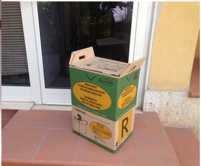
Kosh per transportin e mbetjeve